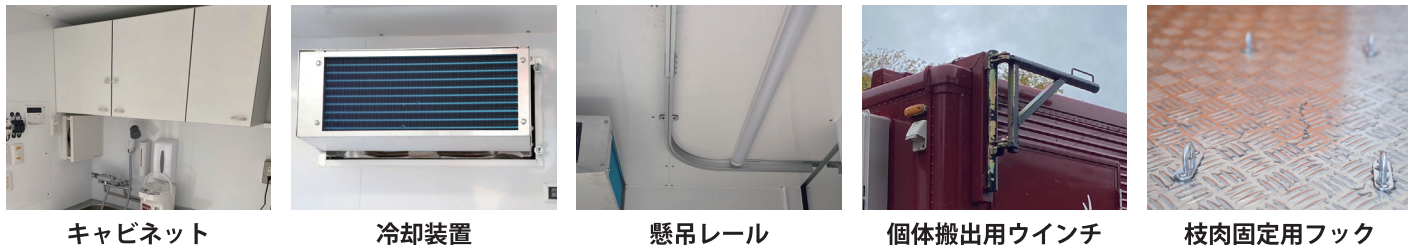
キャビネット 冷却装置 懸吊レール 個体搬出用ウインチ 枝肉固定用フック