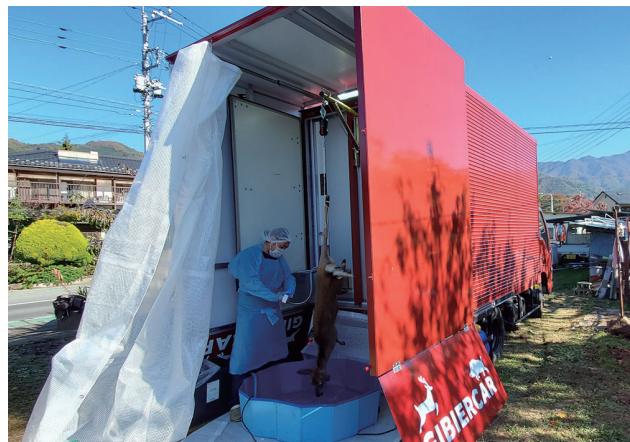
※撮影のため後方を開放しています。