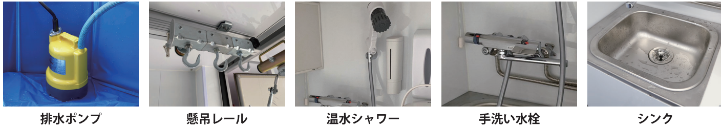
排水ポンプ 懸吊レール 温水シャワー 手洗い水栓 シンク