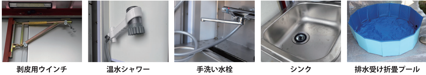
剥皮用ウインチ 温水シャワー 手洗い水栓 シンク 排水受け折畳プール